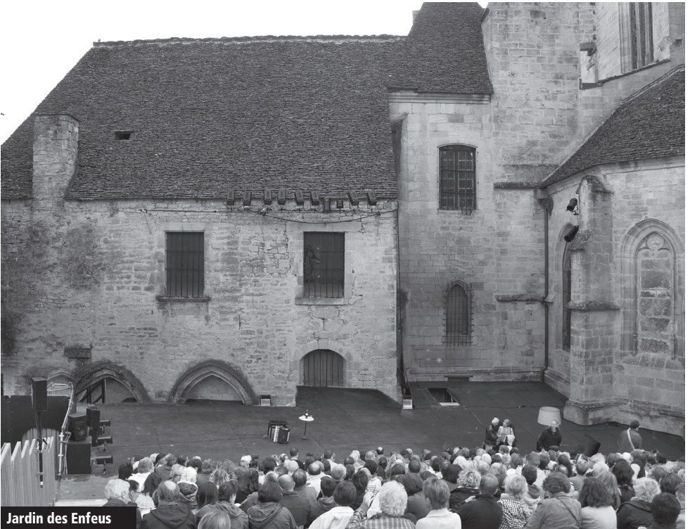
Jardin des Enfeus